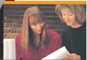
ការហ្វឹកហាត់នៅកន្លែងធ្វើការ ផ្ទាល់ហើយនិងបណ្តាញការងារ

មនុស្សគ្រប់រូបបានទទួលផល ប្រយោជន៍ពេលលោកអ្នកចូល រួមការស្ម័គ្រចិត្ត