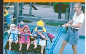
មានផ្តល់លុយកាក់សំរាប់ បង់ថ្លៃមើលថែទាំកូនក្មេង