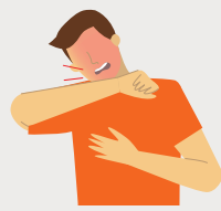
APPARITION OU AGGRAVATION DE TOUX