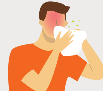
ÉCOULEMENT NASAL OU CONGESTION

Pour trouver un liste des symptômes mis- à-jour, visitez york.ca/covid19