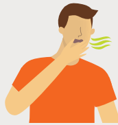
PERTE DE L'ODORAT OU DU GOÛT