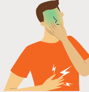
SYMPTÔMES GASTRO-INTESTINAUX (douleur abdominale, diarrhée, vomissements)