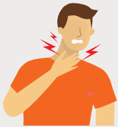
MAL DE GORGE OU DIFFICULTÉ À AVALATOIRE