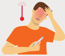
FIÈVRE (Température égale ou supérieure à 37.8°C)